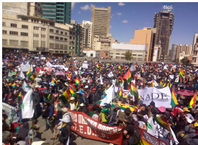
EL GOBIERNO CON LA COLA ENTRE LAS PIERNAS ANUNCIA QUE YA NO HABRÁN MAS INTERVENCIONES EN LOS YUNGAS PEREO QUE NO RENUNCIA A LA ERRADICACIÓN