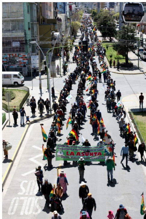
GIGANTESCA MARCHA Y CONCENTRACIÓN DE COCALEROS INGRESÓ TRIUNFANTE A LA PAZ

¡VIVA EL LIBRE CULTIVO Y COMERCIALIZACIÓN DE LA HOJA DE COCA!